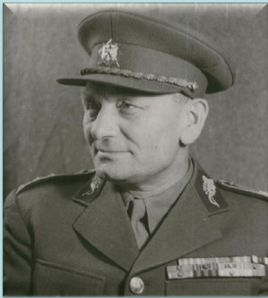
Gen. Sergěj Ingr