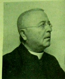
MONSIGNOR JAN ŠRÁMEK MINISTERSKÝ PŘEDSEDA

Celkem je 12 členů prozatímní vlády. Přisaha členů vlády a první ministerská radasekonaly v sídle bývalého Československého národního výboru v Park Street v Londýně.