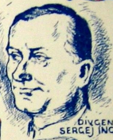
DIV. GEN. SERGEJ INGR