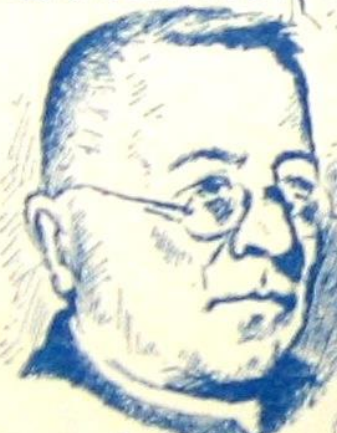
MSGR. JAN ŠRÁMEK