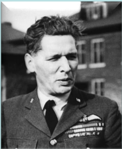
Gen. Karel Janoušek