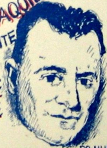
DR. HUBERT RÍPKA