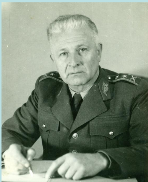
Gen. Ludvík Svoboda