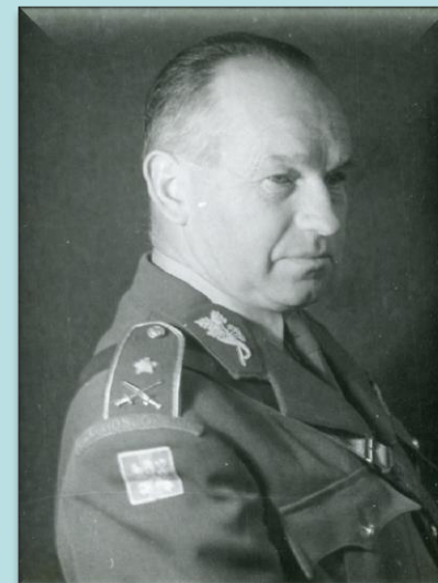
Gen. Alois Liška