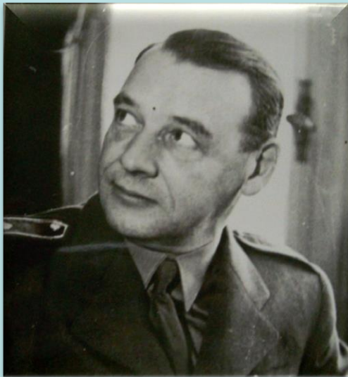
Gen. Rudolf Viest